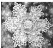
Sanbu-ichi Yusui Spring water.

Pe scurt, el afirma că moleculele de apă în care sunt diluate tincturile mamă preiau informația și energia substanței cu care au venit în contact. Poți face analiza unei dischete informatice și vei obține molecule de vinil și oxid feric, dar informația conținută nu poate fi nici dozată, nici măsurată! [7].